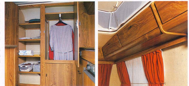
Penderie lingerie caravane Duo

Tous les meubles sont façon bois. Ils sont avant tout fonctionnels, leurs angles sont arrondis. Les tables sont en stratifié.