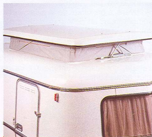
TOILE DE TOIT GARANTIE 6 ANS