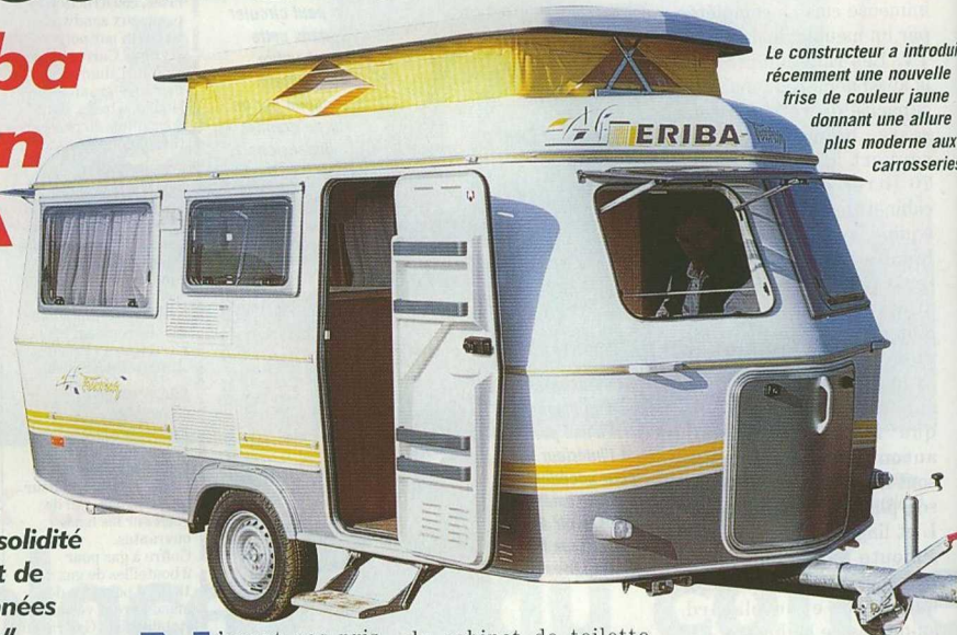
Le constructeur a introduit récemment une nouvelle frise de couleur jaune donnant une allure plus moderne aux carrosseries.

L'ossature en acier, le toit télescopique en polyester et la tôle tendue confèrent à ces caravanes une solidité leur permettant de traverser les années sans "sourciller". Témoin, la version à succès Triton BSA.