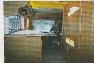
La grande dinette pourra accueillir quatre convives.