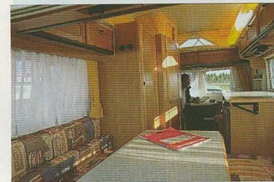
Le coin repas avant se transforme en couchage une place.