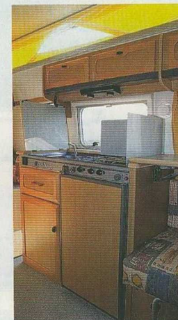
La cuisine reçoit un réfrigérateur de 70 litres à l'instar des "grandes" caravanes.