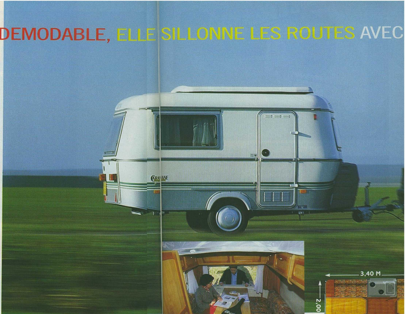
Avec la Familia, n'importe quel conducteur se sent pousser des ailes...

INDEMODABLE, ELLE SILLONNE LES ROUTES AVEC