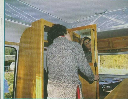
Dans ce petit habitacle, la penderie pourra même servir de coiffeuse.

mettent cependant pas de loger des objets encombrants: on réservera le couloir à cet effet, lorsque l'on voyage. Par ailleurs, ces coffres n'ont pas un accès aisé du fait du poids des banquettes. Il existe toutefois une trappe, à côté de la porte d'entrée, pour loger quelques affaires et accéder au transformateur. Pour se consoler, on se reportera sur les placards de pavillon, ceinturant chaque dinette. D'une hauteur intérieure de 20 cm, ils sont cloisonnés et joueront le rôle de lingère, en complément de la penderie (H 93 cm maxi). Celle-ci abrite un volume haut et un meuble bas, prévu pour accueillir le chauffage: la trappe de visite et le branchement gaz sont déjà