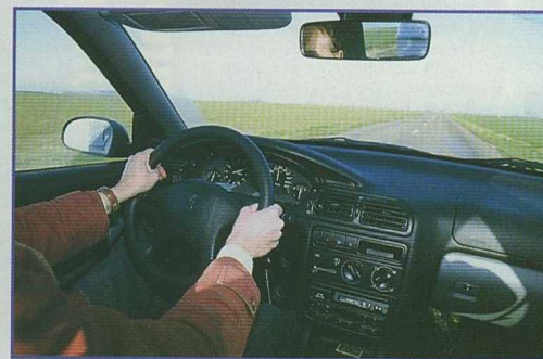
Sur une route bien dégagée, au revêtement de moyenne qualité, on peut rouler vite sans être gêné par la caravane.

C omme son nom ne l'indique pas, la Familia est une deux places offrant la possibilité d'héberger un convive en lui proposant le lit dinette avant.