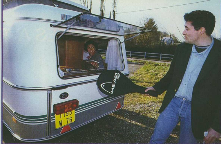
La baie arrière, donnant sur le salon, est la plus grande de l'habitacle.

S urprise! La cuisine offre des dimensions proches d'un meuble de caravane standard, de même que sa hauteur (90 cm), à quelques centimètres près. L'équipement comprend un combiné inox évier et réchaud deux feux. Les couvercles rabattables serviront de plan de travail à ce coin ventilé par une baie ouvrante. A côté du