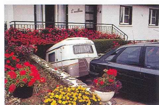
surbaissée elle entre dans votre garage