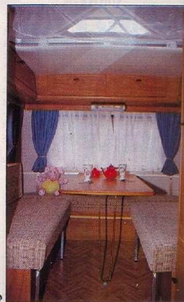
2 Les banquettes des deux dinettes sont équipées de ressorts augmentant la qualité du confort.