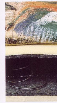
Matelas à ressorts.