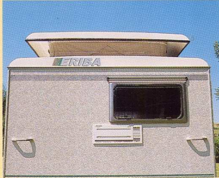
Toit soulevant surdimensionné.