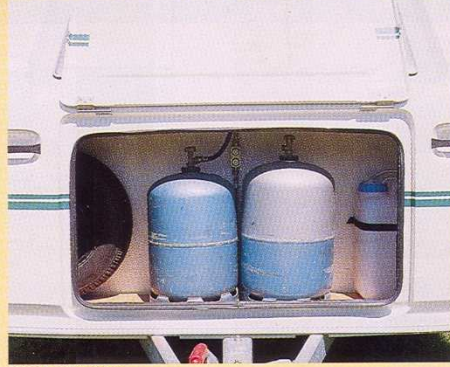
Grand coffre à gaz.