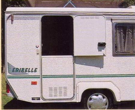
Grande porte «ÉCURIE».