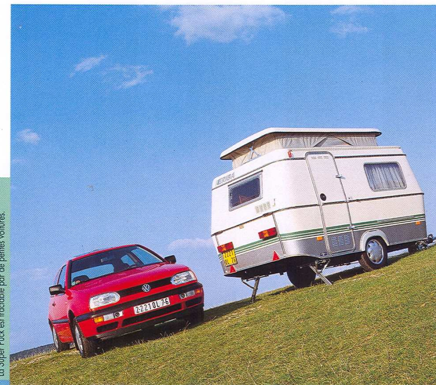
La Super Puck est tractable par de petites voitures.