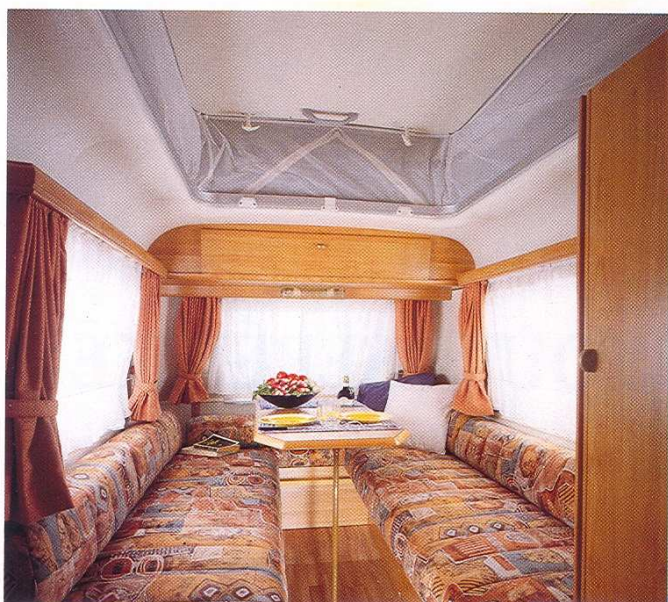
Tant d'espace dans une caravane si compacte.