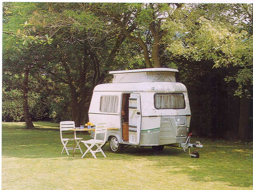
La Puck a sorti son toit télescopique.