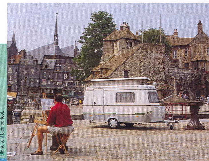
Elle se sent bien partout.

Dans tous les paysages, par tous les itinéraires, vers toutes les aventures les Puck et Super Puck sont les caravanes de la sérénité.