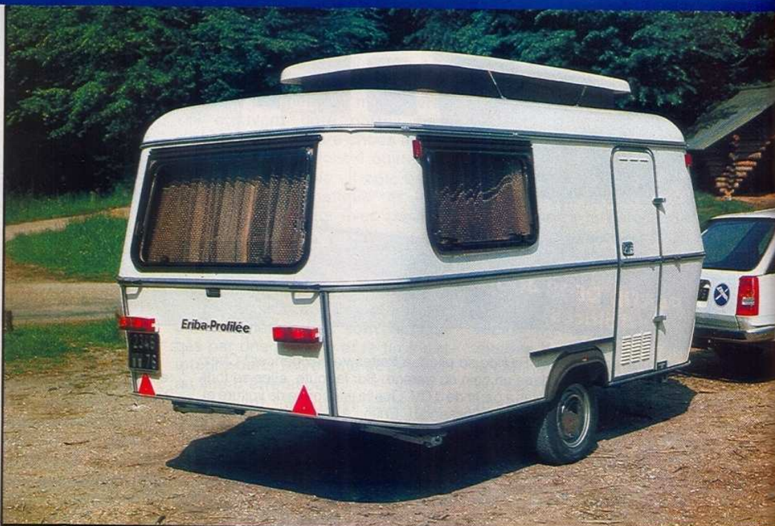
Nouvelles baies, entoilage de toit marron, assistance d'ouverture de ce toit : trois des nouveautés Eriba.