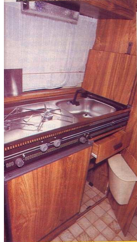
La cuisine est dotée d'un niveau d'équipement très satisfaisant.