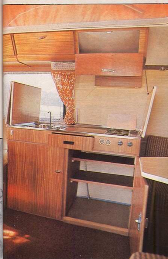
Un bloc-cuisine latéral complet et bien conçu.