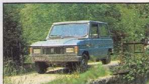
L'Aro se défend bien.

Pour Moteur phénoménal de souplesse. Finition intérieure. Maniement des leviers. Bruit minimum. Contre Encombrement. Prix. Direction. Émission de fumées.