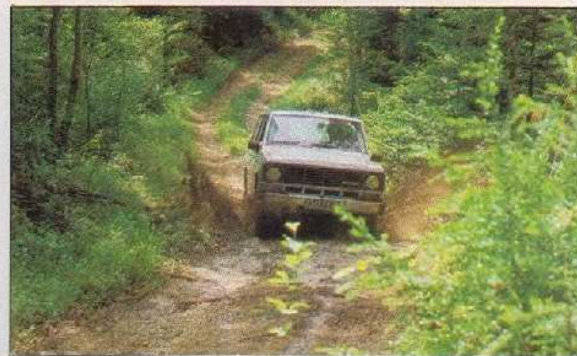
Souplesse diabolique du Datsun Patrol.

L'Aro 103, ce n'est pas la frime, c'est plutôt tout le contraire. Avec son grand corps sur ses petites pattes, il est loin d'avoir l'allure d'un Range ou d'un Mercedes. Tant pis. « Au diable l'esbrouffe, je ne suis pas prétentieux ». De fait, son petit moteur 1 289 cm 3 (larmes sur les joues des exposés de R 12) se contente de 54 ch et d'un petit couple de 9 m.kg. C'est peu, surtout s'il vous prend l'envie d'aller tester ses possibilités hors macadam, à 500 km de chez vous : 115 km/h maxi. Le volant géant et trop fin a du mal à faire oublier la fermeté de la direction. La fermeté n'est pas le lot du levier de vitesses, plutôt inconsistant. Le levier de crabotage en revanche, est très facile à manipuler. Côté confort, ce n'est ni pire ni mieux que les autres