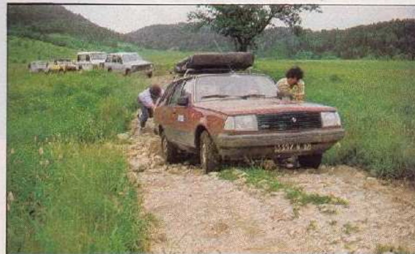
Rude passage pour le R 18